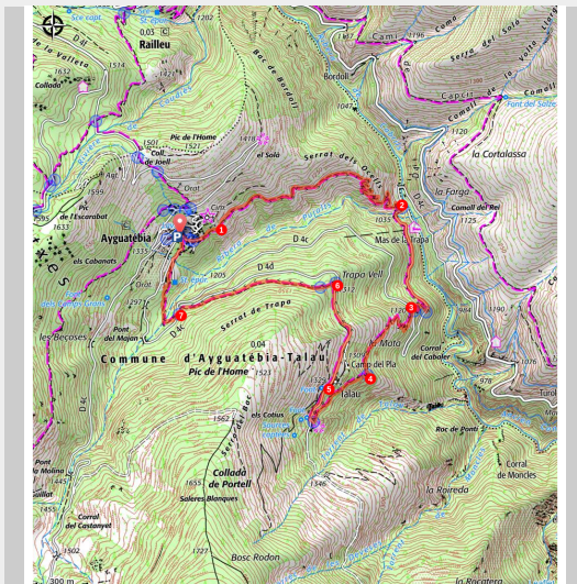
Village d'Aiguatèbia

Découvrez la vallée des Garrotxes et son magnifique panorama sur le massif