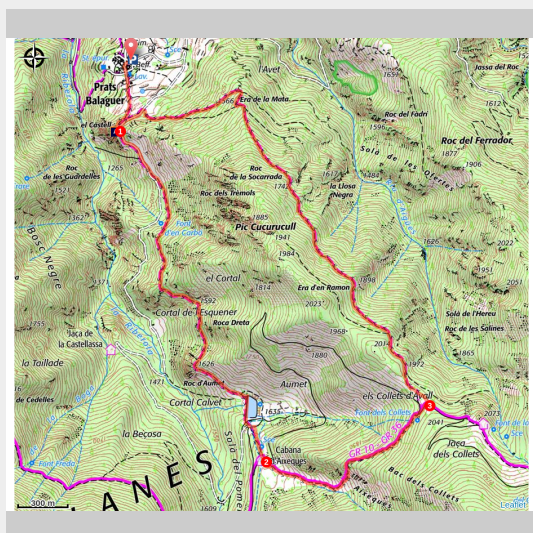
El Castell (OTI Conflent Canigó)