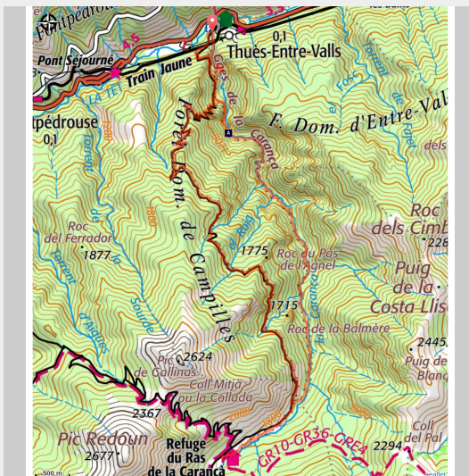
Sur la corniche des Gorges de la Carança (JC Milhet)