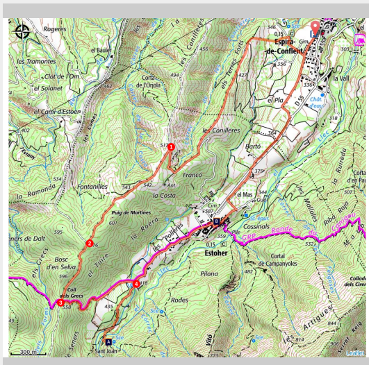
Chapelle Sant Joan de Seners (OTI Conflent Canigó)